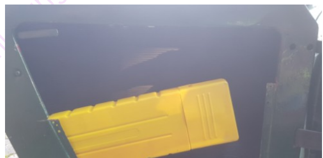
Die Matte ist drin, das Warndreieck drückt auf die Fläche.

Während des Klebens konnte ich leider nicht fotografieren, da ich alle Hände voll zu tun hatte. Ich brauchte 4.