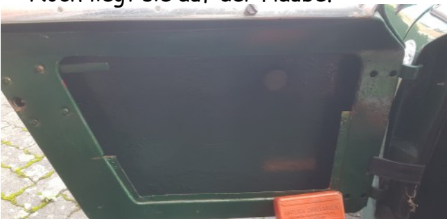
Türtasche ist raus, der Magnet nach dem Foto. Trockenübung, wie groß ist die Matte?