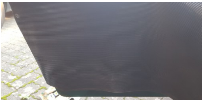
Trockenübung, wie groß ist die Matte?